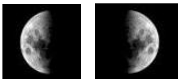
Hemisferio Sur Hemisferio Norte